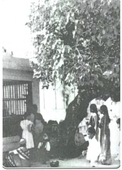
பூவரசு மரத்தடியில் ..... புண்ணியனார் சமாத மேல் .....

வேண்டும் வரம் தரவே 65 வேலனுக்கு தீர்த்தமிங்கே -66 வெள்ளி மயிலே துள்ளி ஆடு 263 வேலவா வேலவா வடி வேல 264 வேலவன் சிவனை பூஜித்த - 48 வேல் அழகன் - 15 வேலவனை வேண்டி நின்றே 264 வேலா வேண்டுகின்றேன் - 265 வேலவன் வீதி வரும் -59 வைரவா சந்நிதி வைரவா - 376 லிங்காபிஷேகம் - 298 ஞானமும் நீயே கந்தா ஆனந்த 50 ஸ்ரீ செல்வச் சந்நிதிக்கு வா. - 11 ஸ்ரீ செல்வச் சந்நிதி. வேலா 266 ஸ்ரீ முத்துமாரி ஊஞ்சல் - 324 ஸ்ரீ முத்துமாரி தீபஆராத்தி - 325 ஸ்ரீ விநாயகர் அகவல் - 290 ஸ்ரீ லலிதா நவரத்தின மாலை305 ஸ்ரீ செல்வச் சந்நிதன் திருவி347